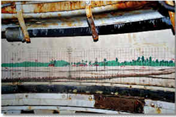
Dans la tour à ciment de la rue du Bloc L de Bréhaïn, le panorama de fin du carnaval Dumetz est particulièrement réussi. Chaque maison, chaque arbre, chaque objet de la décoration est représenté avec un soin et un détail, à savoir même à même pas avoir de lignes d'horizon. Il y a aussi de la végétation, des fleurs, des oiseaux, des animaux, des personnes et des objets divers.