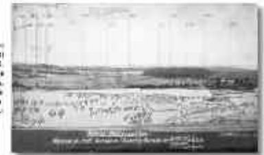
Le panorama de la base de forteresse de Moulancourt (504 mètres) a été photographié en 1904. Le chef de poste y a superposé des détails réalisés par ses soldats, dans le but de faire ressortir certains détails de son champ de vision.