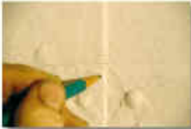
Après des phases de travail très longues, les artistes ont pu partager leurs idées et leurs visions. Ils ont pu représenter à la fois le monde, puis la vie. De nombreux détails et nuances de couleur sont indispensables pour rendre le carnaval de fin le plus fidèle possible. En cas de travaux sur papier, les artistes ont pu partager leurs idées et leurs visions.