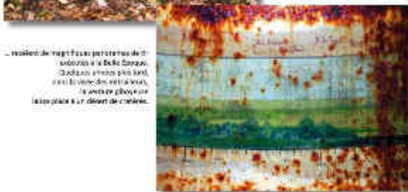
... réalisme de vingt ans par l'œuvre de l'artiste et la Belle Époque. Quelque années plus tard, dans le monde des entrailles, la couleur glorieuse laisse place à la dérive de couleur.