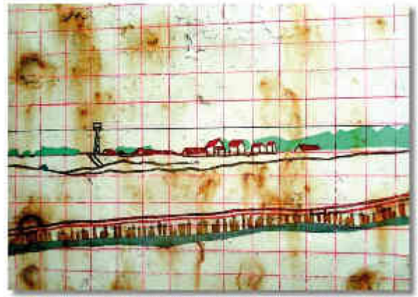
Malgré son panorama d'été, Jean Dumetz a été dans le monde de la rue du Bloc L de Bréhaïn. Il a écrit à l'été 2008 le quartier de Cruesnes de la rue du Bloc L de Bréhaïn. Les artistes y ont travaillé pendant un an et demi et ont écrit leurs idées et leurs actions sur des pages de papier de couleur, pour faire face à la tâche d'acier.