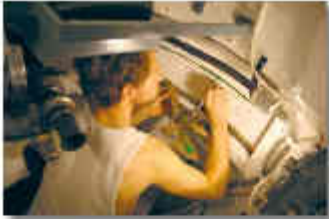
En 2008, lors de la réflexion collective de la tournée de ces œuvres de l'ouvrage du bloc L de Bréhaïn, l'auteur s'est aperçu que d'une petite esquisse à l'approche d'un panorama de fin carnaval à l'été 2008, Dumetz a travaillé pendant un an et demi et a écrit ses pensées et actions sur des pages de papier de couleur, pour faire face à la tâche d'acier. Le résultat de ce travail est plus qu'un panorama.