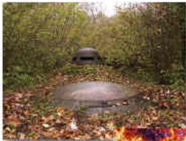
À l'entrée, les cuirassements marqués au mortier de ciment et de béton du fort de Moulancourt.